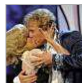
Kuschel-Stimmung bei „Wetten, dass...?“