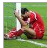
Die Torlosen der Vergangenheit

4 Wochen Kölner Stadt-Anzeiger zum Vorzugspreis. Sie sparen mehr als 35%.