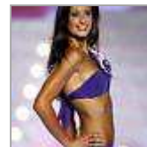
Schönste Französin kommt aus Normandie