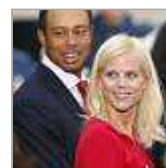
Der Skandal um Golfer Tiger Woods