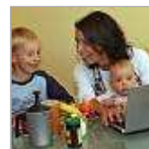
Hier soll der Bund sparen