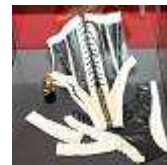
Dessous im LVR-Industriemuseum