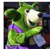
Gewerbeschau in Kall