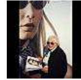
Foto des Jahres 2009

Der Leser-Wettbewerb Euskirchen geht in die nächste Runde. Senden Sie Bild dem Urlaub oder von zuhause, denn es winken tolle Preise.