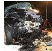
Schwerer Unfall bei Mechernich