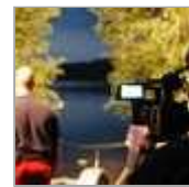
Suchaktion am Liblarer See