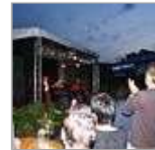
Musiker machen „Gemeinsame Sache“