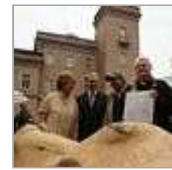
Neue Kunst aus altem Holz