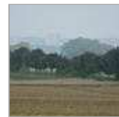
2000 Jahre Verkehr