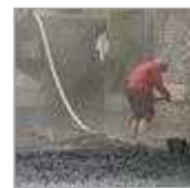
Schloss Gracht wird saniert