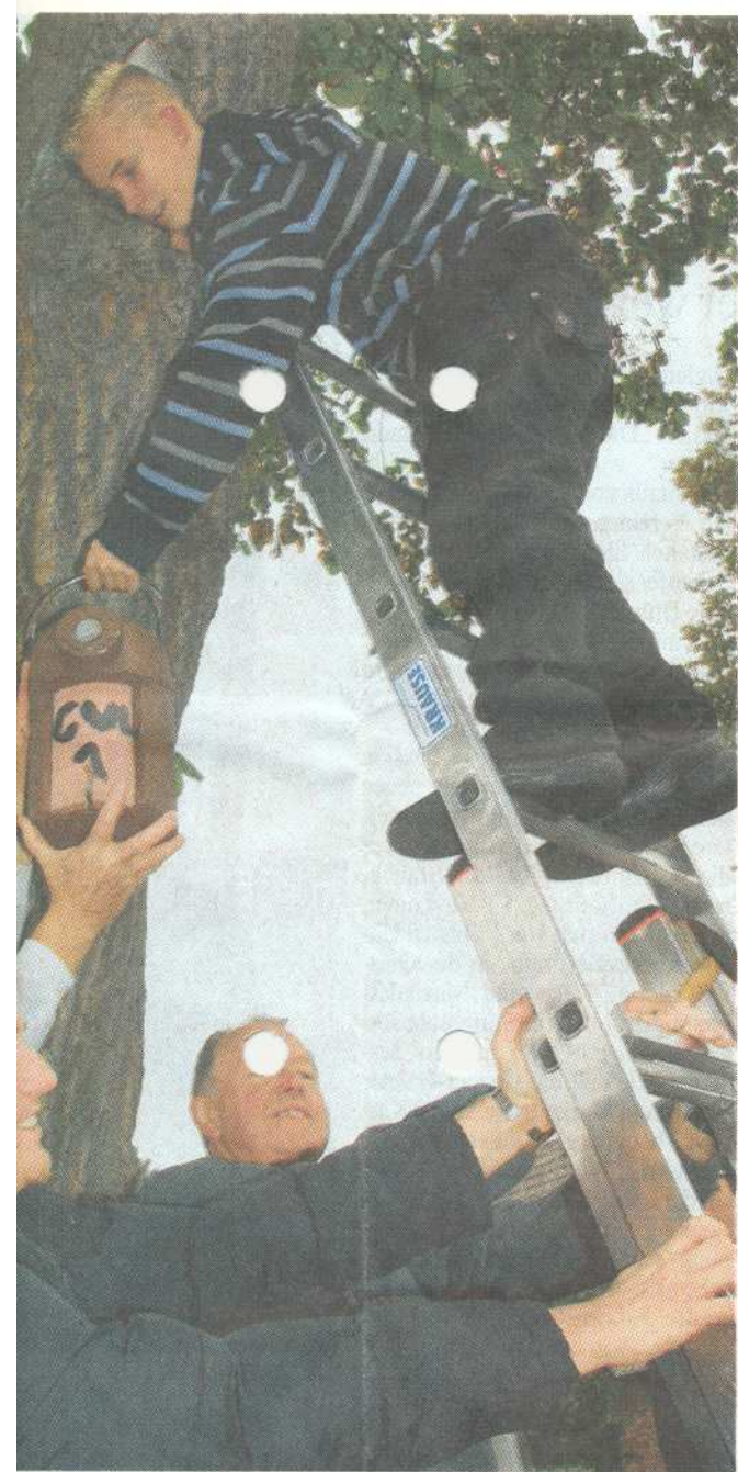
sich gestern um die Nistkästen am Stadtweiher. Sie wollten den „Ältereinsverein Arbeit abnehmen.

Daran änderte auch das sogenannte Fachgespräch, bei dem Experten auf dem Podium saßen, nichts, zumal Moderator Wolfgang Mödder den Vertreter von Geysr lautstark anging. Dieser versprach, „wenn es so weit ist“, ebenfalls zu einer Informationsveranstaltung zu laden. Die Bürger befürchten allerdings, dass es dann bereits zu spät sein könnte für ihre Anliegen.